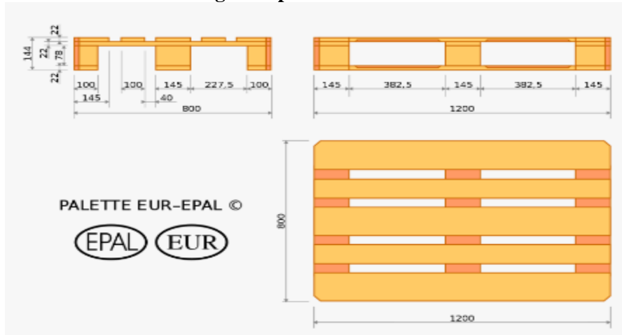
Imagem do palete EURO/EPAL