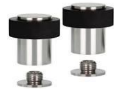
Batente de porta em borracha e aço inox com fixação ao pavimento