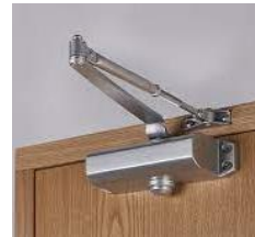
mola hidraulica em aço inox para portas de madeira